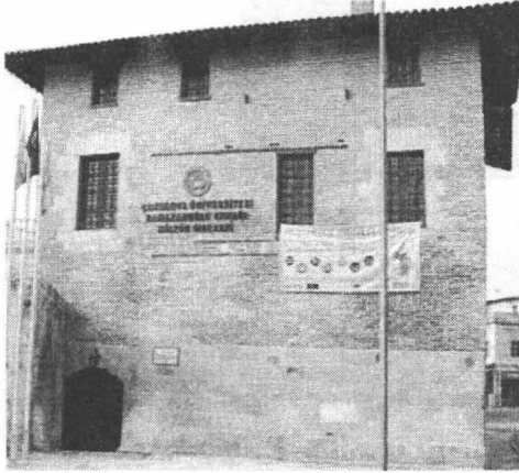
FOTOĞRAF 8: Ramazanoğlu Vakıf Sarayı. Ramazanoğlu beyliği konağının Selamlık bölümünden ibaret olan yapı, suanda Çukurova Üniversitesi Kültür Merkezi olarak kullanılmaktadır.

“Babamın işleri bozulunca annemle birlikte Mersin'den Adana'ya döndük. O zaman biz Vakıf Sarayında (Ramazanoğlu konağı) oturuyorduk. Dayım bir sebepten İstanbul'a taşınınca nenem yalnız kalmasın diye Tepebağa Akverdilerin evine taşınarak beraber yaşmaya başladık. Bu evde 1946 depremine kadar oturduk.” (Nephana, 1931).