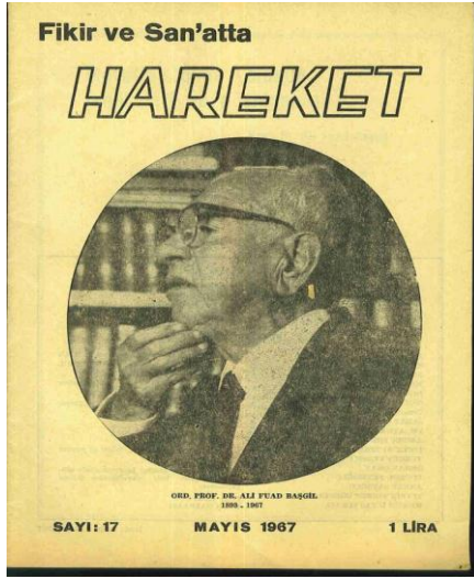
Fikir ve San'atta Hareket dergisi