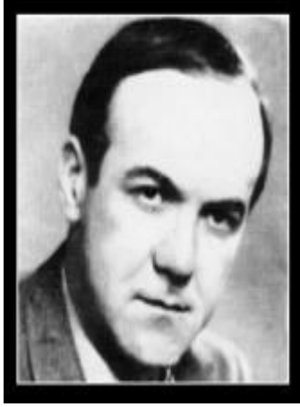
Hilmi Ziya Ülken