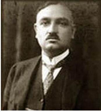
Yahya Kemal Beyatlı

Anadoluculuk fikri, çok kısa bir zamanda kabul görmüş, pek çok şair ve yazar tarafından desteklenmiştir. Bu şair ve yazarlar içerisinde şüphesiz ki en dikkati çeken isimlerden biri Yahya Kemal Beyatlı'dır. Daha önceleri Yunan Medeniyeti hayranlığına kapılarak Yakup Kadri ile birlikte Nev-Yunanîlik 10 adı verilen bir hareket oluşturmaya çalışan Yahya Kemal, Anadolu Mecmuası'nın son sayılarında derginin yazı kadrosuna katılmış ve Anadoluçuluk hareketini desteklemiştir.