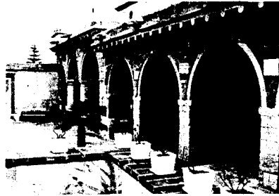
Hacı Bektaş Veli Dergahı iç avlusu

Karahanlıların 999 yılında Samanoğulları Devleti'ne son vermele-riyle artık bütün Türkistan ve Horesan, kısaca Maverâünnehir, Türkle-