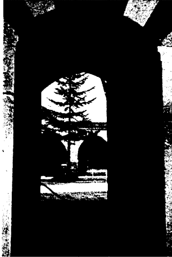
Hacı Bektaş Veli Dergahı giriş kapısı

Üçüncü derece Babalıktır. Ehliyeti görülen derviş görülen lüzum üzerine yahut muhiblerin Dede babaya müracaatları üzerine halife tarafından durumu incelenerek baba yapılır ve kendisine icazetname verilir. Babalar peygamber soyundan iseler taclarının üzerine yeşil değilse beyaz sarık sararlardı. Görevleri muhib ve derviş yetiştirmektir.