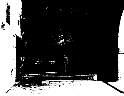
Hacı Bektaş Veli Dergahı'nda Arslanlı Çeşme

Bektaşilik 13. yüzyılın ortasından itibaren Anadolu'nun Moğol istilasına uğradığı, halkın kendi kurumlarını kurmaya ve ayakta kalmaya çalıştığı bir düzlemde Ahi örgütüyle ve diğer batını zümrelerin tabanı üzerinde kurulmuştur.