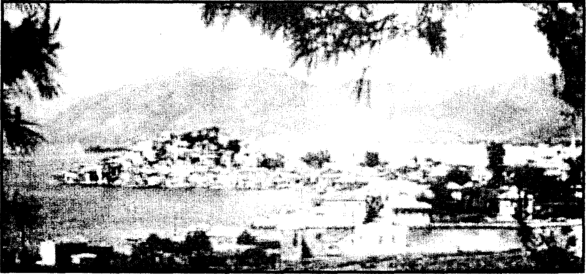
Eski Marmaris'ten bir görünüş