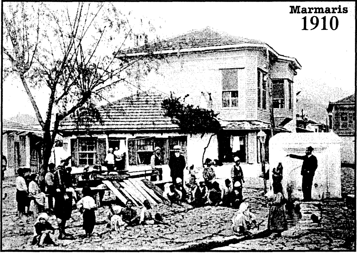
Eski Marmaris eşme Meydanı (Bugünkü Şadırvan)