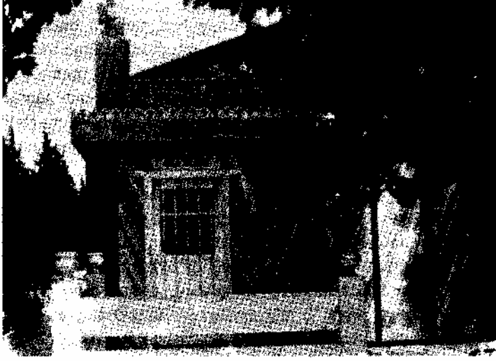
Lyonel A. Makzume Aile Mezarlığı

Gayrimüslimlere ait olan mezarlarda müslüman mezarlarında olduğu gibi yazı bulunmayıp sadece haç işareti ile doğum-ölüm tarihleri ve kişinin adı bulunmaktadır. Bazılarında ise melek motifleri yer almaktadır.