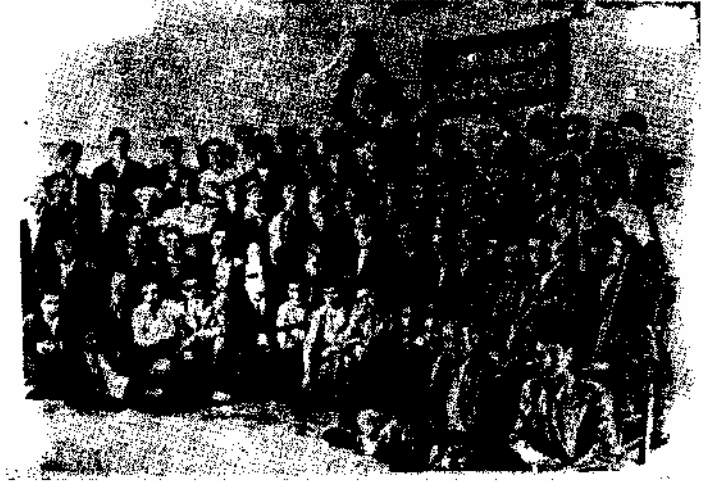
Çukurova'ya yerleşen Türkistanlıların 1952 yılında Adana'da tertiple- dikleri bir toplantıdan görünüş.

Not: Bazı aile reisleri birden fazla gazete okumakta, ayrıca 44 aileden 24 aile gazete-mecmua okumakta geri kalan 20 aile okumakta.