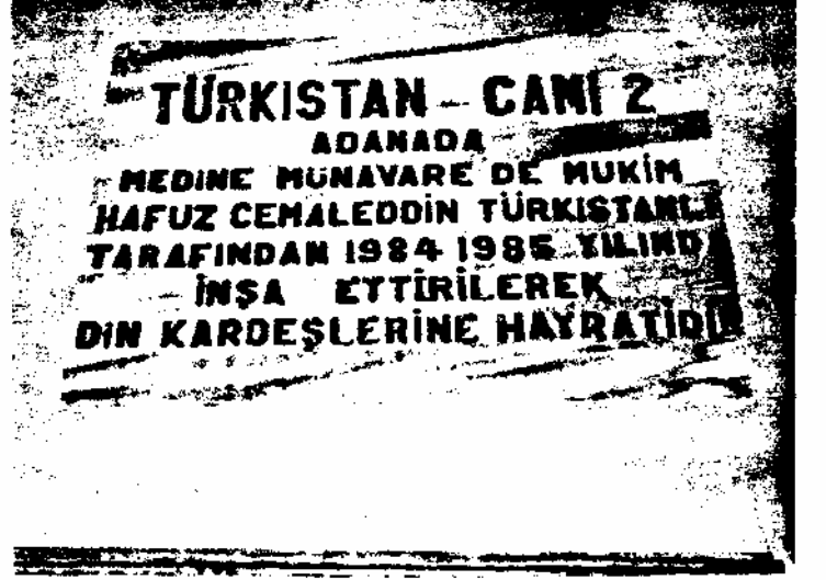
Kâzım Başer Mahallesiindeki "Türkistan Camii 2"nin Kitabesi

Çukurova'ya yerleşen Türkistanlı 44 aile reisinin doğum yeri