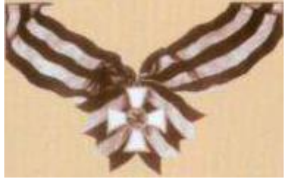
Kahramanlıkla hayatını kaybeden Üsteğmen Ferruh Ağa Gayıbovun ölümünden sonra taltif olunduğu "Mükaddes Georgi" Nişanı