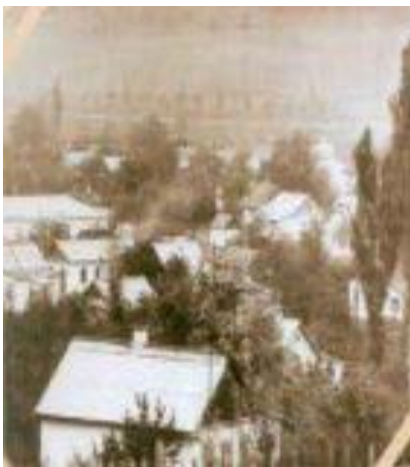
Ferruh Ağa Gayıbovun doğduğu Kazak ilinin Yukarı Salahlı köyü (1977).