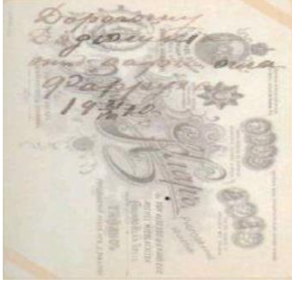
Ferruh Ağa'nın fotoğrafının arkasındaki imzası.