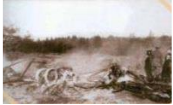
"İlya Muromets-16" uçak-ekipajının parçalandığı yer. 12 Eylül 1916.