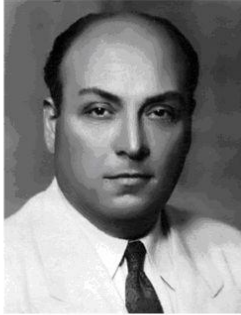
Yusuf Ziya Ortaç

Akbaba mecmuası, 7 Birincikânun 1338(7 Aralık 1922) tarihinde Yusuf Ziya Ortaç ve Orhan Seyfi Orhon tarafından yayınlanmaya başlamıştır. “Orhan Seyfi, dergiyi daha sonra Yusuf Ziya’ya devretmiş ve Yusuf Ziya da ölünceye kadar tek başına çıkarmıştır.” 5