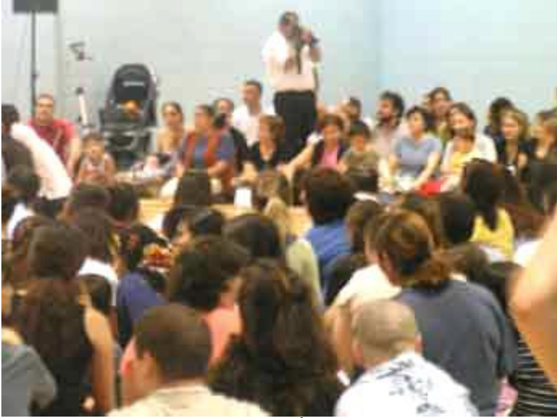
Kanada'da İlk Cem

Abdal Musa (Birlik) Cemi düzenlendi. (8 Ağustos Pazar - Joseph J. Piccininni Community Centre`da)