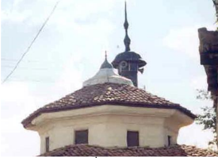
19.08.2004 Perş. 16:40