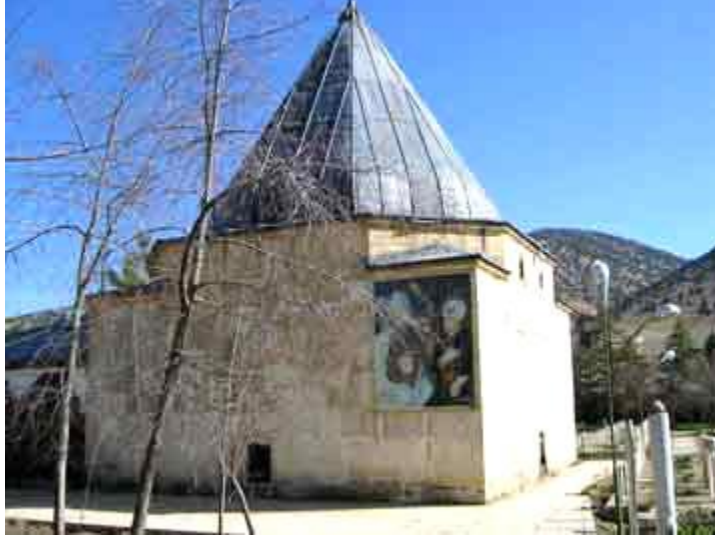
Antalya/Elmalı - Tekke Köyü