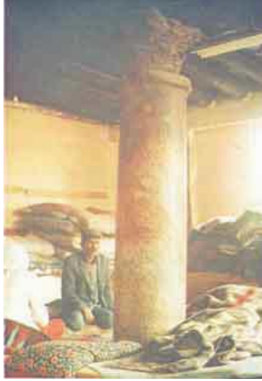
Korint Başlıklı Sütun

Anlatılan bir menkıbeye göre eskiden Çeltek Köyü'nün olduğu yerde gayrimüslimler oturmakta imiş. Dinî liderleri kendi dinî inançlarına göre elindeki kitaba bakarak "Buraya birisi gelecek. Biz buradan uzaklaştıracağız." dermiş.