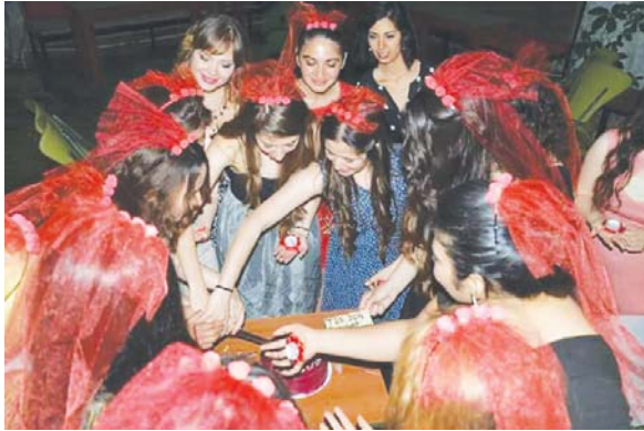
Fotoğraf 5: Mezuniyet Kınasında Pasta Kesen, Başlarına Kırmızı Tüller Takmış Muğla Sıtkı Koçman Üniversitesi Öğrencileri