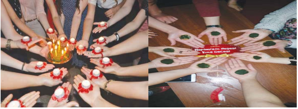
Fotoğraf 1-2: Ellerine Mezuniyet Kınası Yakmış Muğla Sıtkı Koçman Üniversitesi Öğrencileri