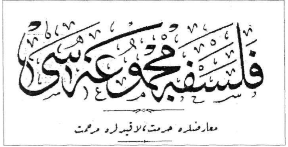
(Üstte) Baha Tevfik'in çıkardığı Felsefe Mecmuası. (Sağda) Felsefe-i Ferd kitabının kapağı.

Baha Tevfik'in doğum yılı, incelediğimiz birçok eserde çoğunlukla 1881, bazen de 1882 olarak verilmektedir, ancak bu tarih onun yakın mesai ve fikir arkadaşı Dr. Subhi Ethem'in verdiği tarihle (1 Nisan 1300/13 Nisan 1884) 4 uyuşmamaktadır. Bu eserlerdeki kaynakları belirtilmeyen 1881 ve 1882 tarihlerinden farklı olarak, Abdullah Uçman'ın verdiği 1884 tarihinin 5 asıl kaynağının da (Uçman'ın kullandığı bibliyografyaya bakarak) Mehmet Ö. Alkan'ın bir makalesi 6 aracılığıyla yine Suphi Ethem'in ver-