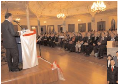
IV. kdar Sempozyumu'nun aılıı