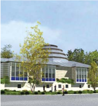
Evlendirme Dairesi ve Kültür Merkezi