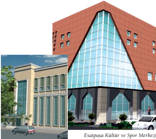
Yavuztürk Kültür Merkezi