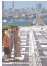
Beylerbeyi Meydan Tasarımı