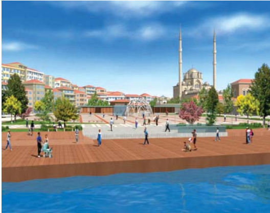
Üsküdar Meydanı ve Çevresi Kentsel Tasarım Projesi