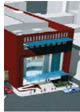
Müsaipzade Celal Tiyatrosu Projesi