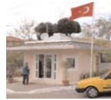
Taksi durakları modeli