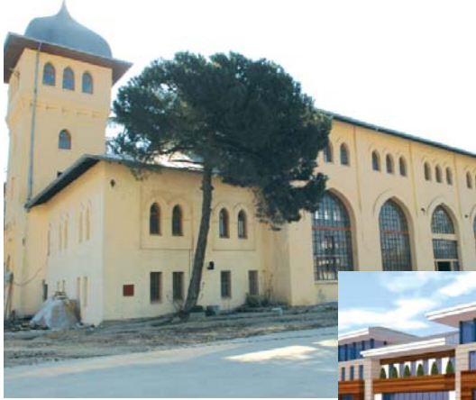
Bağlarbaşı Ulaşım ve Tarihi Eserler Müzesi

Aziz Mahmud Hüdâyî Külliyesi Yapılarındaki Kalem İşleri Dr. Candan Nemlioglu Aziz Mahmud Hüdâyî Külliyesi Şeyh Dairesi Belgeleme Çalışmaları Esra Balcı Hazret-i Hüdâyî Âsitânesi'nin Hazîresini Ziyâret M. Cemal Öztürk Aziz Mahmud Hüdâyî Türbesinde Bulunan Envantere Kayıtlı Etnografik Eserler Erman Güven İdari Açıldan 1925 - 1990 Arasında Aziz Mahmud Hüdâyî Türbesi Seyfettin Ünlü (Osmanlı Döneminde) Aziz Mahmud Hüdâyî Vakfı ve Faaliyetleri Meral Şahin Hüdâyî Vakfı'nın 17. Yüzyıldaki Hizmetlerine Çağdaş Sivil Toplum Anlayışı İle Bir Yaklaşım Dr. Cangüzel Güner Zülfikar (19. Yüzyıl İkinci Yarısı) Üsküdar Sosyo Ekonomik Yapısında Aziz Mahmud Hüdâyî Vakfının Yeri Doç.Dr. Gülfettin Çelik Aziz Mahmud Hüdâyî Camiindeki Ağaç İşleri Üzerine Prof. Dr. H. Örcün Barışta