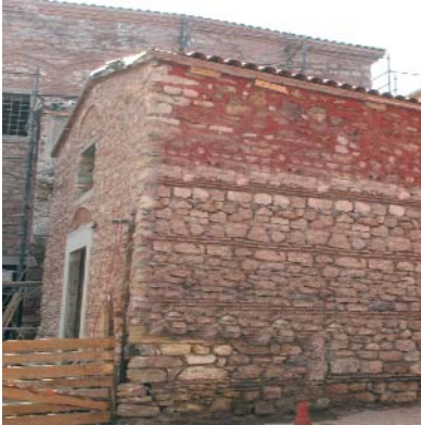
Restore edilen Fatih'in Mahkeme Binası: Adalet Tarihi Müzesi