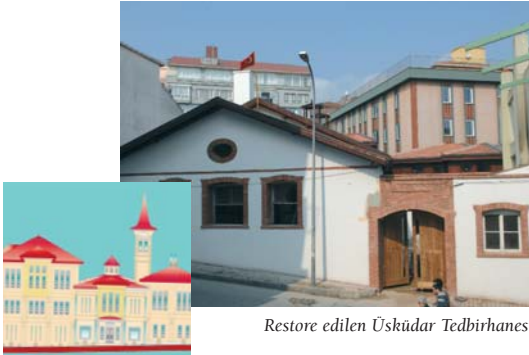
Restore edilen Üsküdar Tedbirhanesi