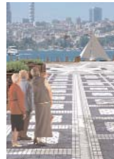
Beylerbeyi Meydan Tasarımı