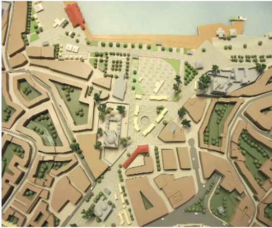
Asrın Rüyası: Marmaray