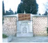
Restore edilen Miskinler Çeşmesi