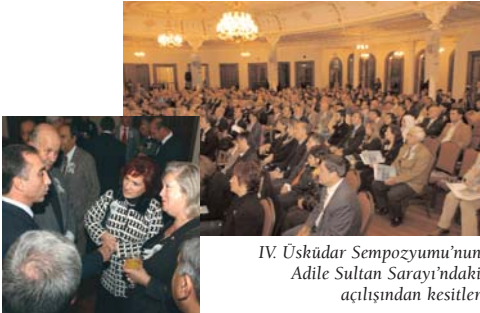
IV. Üsküdar Sempozyumu'nun Adile Sultan Sarayı'ndaki açılışından kesitler