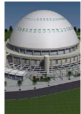
Çavuşdere Spor Kompleksi