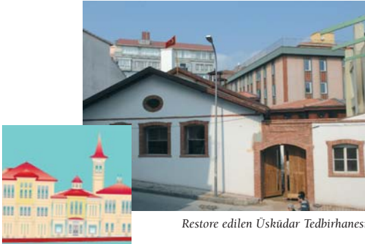
Restore edilen Üsküdar Tedbirhanesi