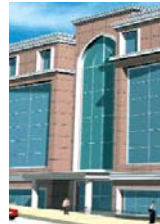
Acıbadem Kültür Merkezi