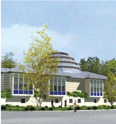
Evlendirme Dairesi ve Kültür Merkezi