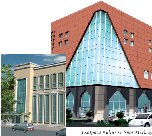
Esatpaşa Kültür ve Spor Merkezi