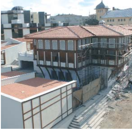
2007'de açılışı yapılacak olan Bağlarbaşı Kültür Merkezi