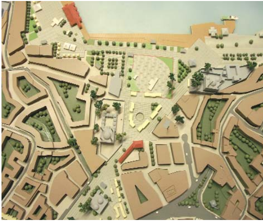
Asrın Rüyası: Marmaray