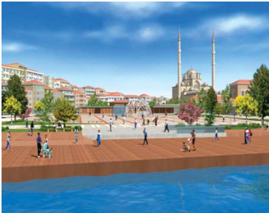
Üsküdar Meydanı ve Çevresi Kentsel Tasarım Projesi