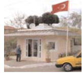
Taksi durakları modeli