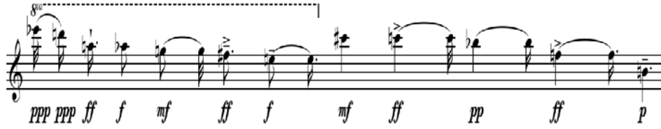
Şekil 2. Serial Müzik: Pierre Boulez'in Structures (1955) eserinde kullandığı dizi.

© 1955. Universal Edition. Used by permission. All rights reserved (Dallin, 1974, s. 213).