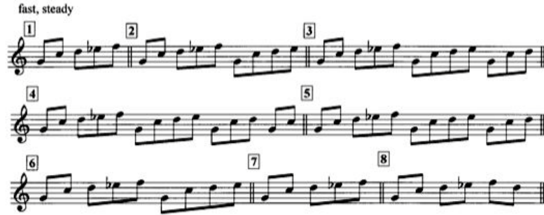
Şekil 4. Minimal Müzik: Philip Glass'ın Two Pages eserinden sekiz tekrar.

© Dunvagen Music Publishers, Inc. Used by kind permission. All rights reserved (Haskins, 2005).