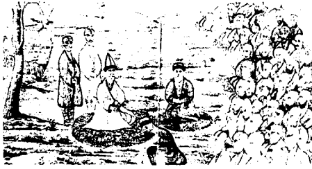
Hacı Bektaş Veli ve ilk halifeleri minyatürü

İnsanın varlığını tanımaya çok önem veren Hacı Bektaş, bunun için; "ilimle araştırmalı, izlemeli, gözlemeli ve arştan yerin altına kadar her ne varsa kendinde