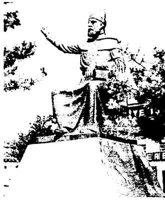
Hacı Bektaş-ı Veli Heykeli

Hacı Bektaş'ın inanç ülkelerini, fikirlerini açıklayan ve onun şahsiyetini tanımamıza kaynaklık eden Makâlât'ın aslı arapça olduğu, ancak daha sonra Türkçeye çev-