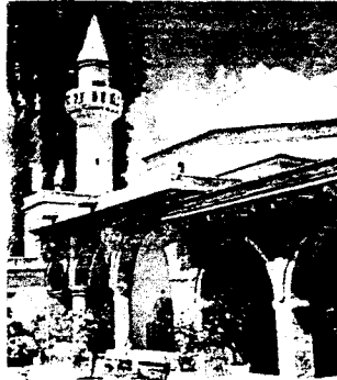
Hacı Bektaş Veli Külliyesi, 2. Avlu

Nedense Hassâki (haseki) diğelerine göre daha çok zikredilmektedir. 54 Hassâki'nin pâdişahın emrinde oldu-