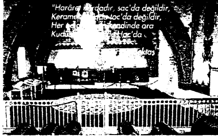
Hacı Bektaş-ı Veli Külliyesi, Kırklar Meydanı

Çeliği taşa vurmak 75 gibi meşguliyetler toplumun geli- mişliğinin örneğidir. Yoldan taşları temizlemek 76 gibi mede- nî insanlara yakışır işlerin XIII. yüzyıl Anadolu'sunda görülmesi toplum yaşayışında dikkat edi- len hususlardan biri olarak Ma- kâlât'tan öğrenmekteyiz.