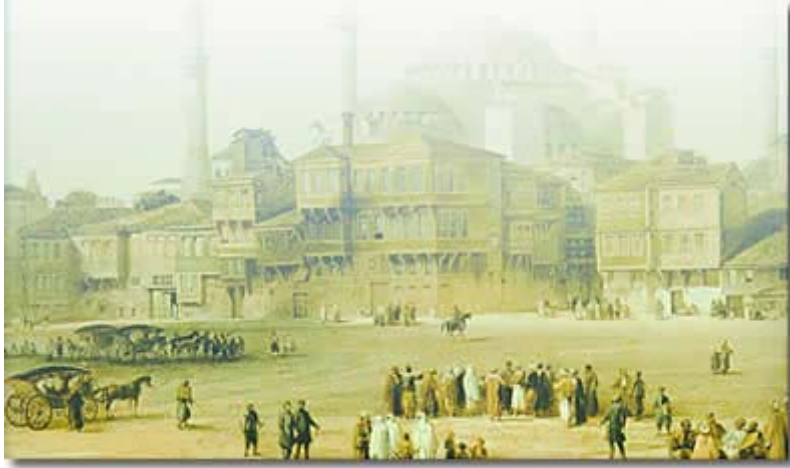
Osmanlı dönemindeki İstanbul'u resmeden bir tablo

BALKANLAR'DAKİ Türk varlığının başlangıcı, genel kanının aksine, Osmanlı döneminden çok öncelere dayanır. İlk olarak Hun Türkleri'yle başlayan bu mevcudiyet, Orta Asya'dan göç eden çeşitli Türk boylarıyla devam etmiştir. Bu topluluklar bölgenin kültürel gelişimine büyük katkıda bulunmuş ancak büyük çapta asimilasyona uğramışlardır. Örneğin Volga boylarında yaşayan ve Türkçe konuşan Bulgar Türkleri, Slavların içinde asimile olmuş ve bir Slav topluluğu olarak anılmışlardır.