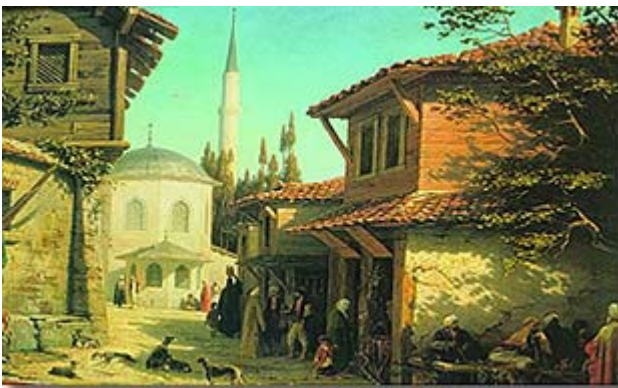
Osmanlı'da günlük yaşamı konu alan bir yağlıboya tablo

İçlerinde zulmedenleri hariç olmak üzere, Kitap Ehliyle en güzel olan bir tarzın dışında mücadele etmeyin. Ve deyin ki: "Bize ve size indirilene iman ettik; bizim İlahımız da, sizin İlahınız da birdir ve biz O'na teslim olmuşuz." (Ankebut Suresi, 46)