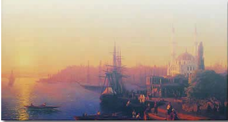
Ayvazovski'nin "İstanbul Manzarası" isimli yağlıboya tablosu

1352'de, tahtı ele geçirmek için Osmanlılardan yardım alan Bizans İmparatoru Kantakuzenos, bu yardımın karşılığı olarak Çimpe kalesi ve çevresini Orhan Gazi'ye bıraktı. Bu bölge, Süleyman Paşa'nın önderliğinde Balkanlar'a yayılmak için önemli bir üs olarak kullanıldı. Anadolu'dan getirilen kuvvetler bu bölgeye yerleştirildi ve Osmanlı'nın Rumeli'deki varlığı kalıcı hale getirildi. Dönemin tarih kayıtlarına göre başta Bolayır ve Malkara olmak üzere, bölgede, Bulgurlu, Esendük, Şeyh Halil, Kara Ahi gibi Türkçe isimler taşıyan çok sayıda köy ve yerleşim yeri kurulmuştu. 3