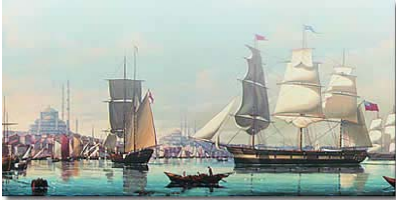
"İstanbul'da Yelkenliler", duralit üzeri yağlıboya, Salvatore Colacicco

Türkleri yerleştirilmiştir. Bu Müslüman Türk gruplar buldukları bölgede İslamiyetin yayılmasına katkıda bulunmuşlardır. Saltukname adlı ünlü eser bu çalışmalarını konu edinmektedir. 1