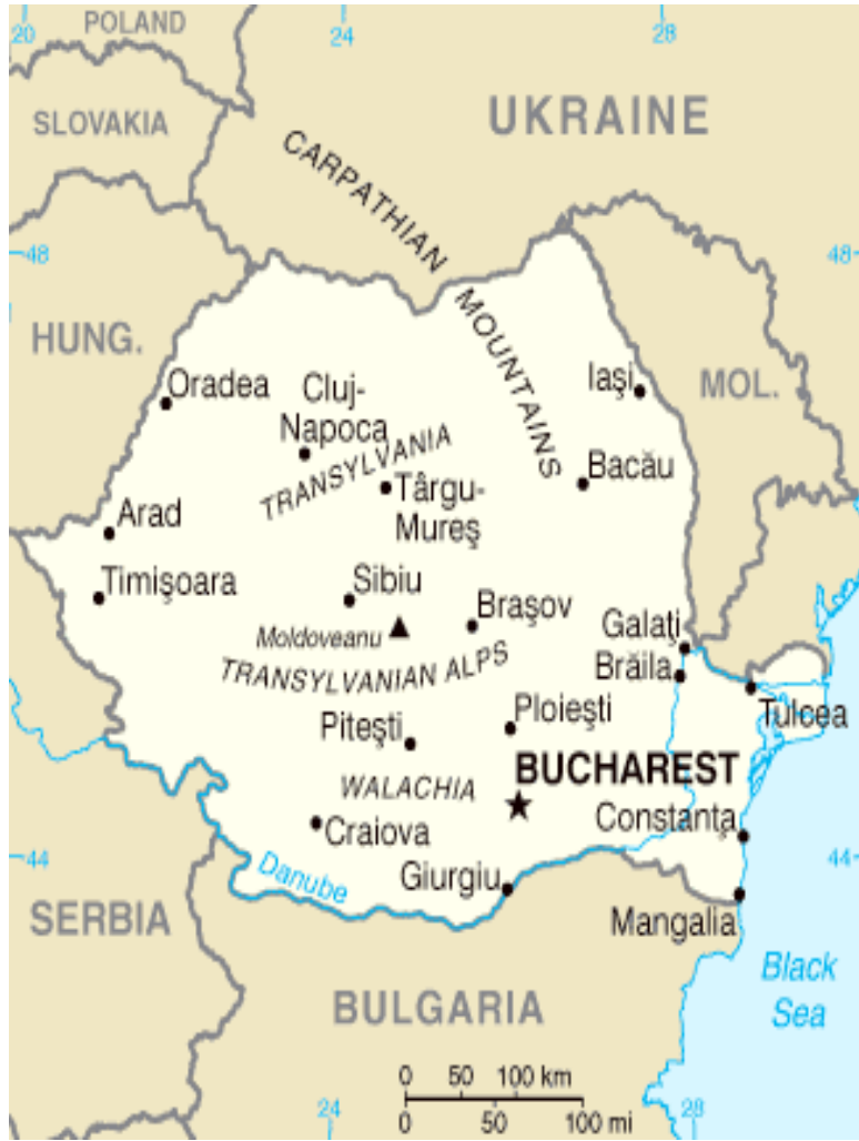
Şekil 2: