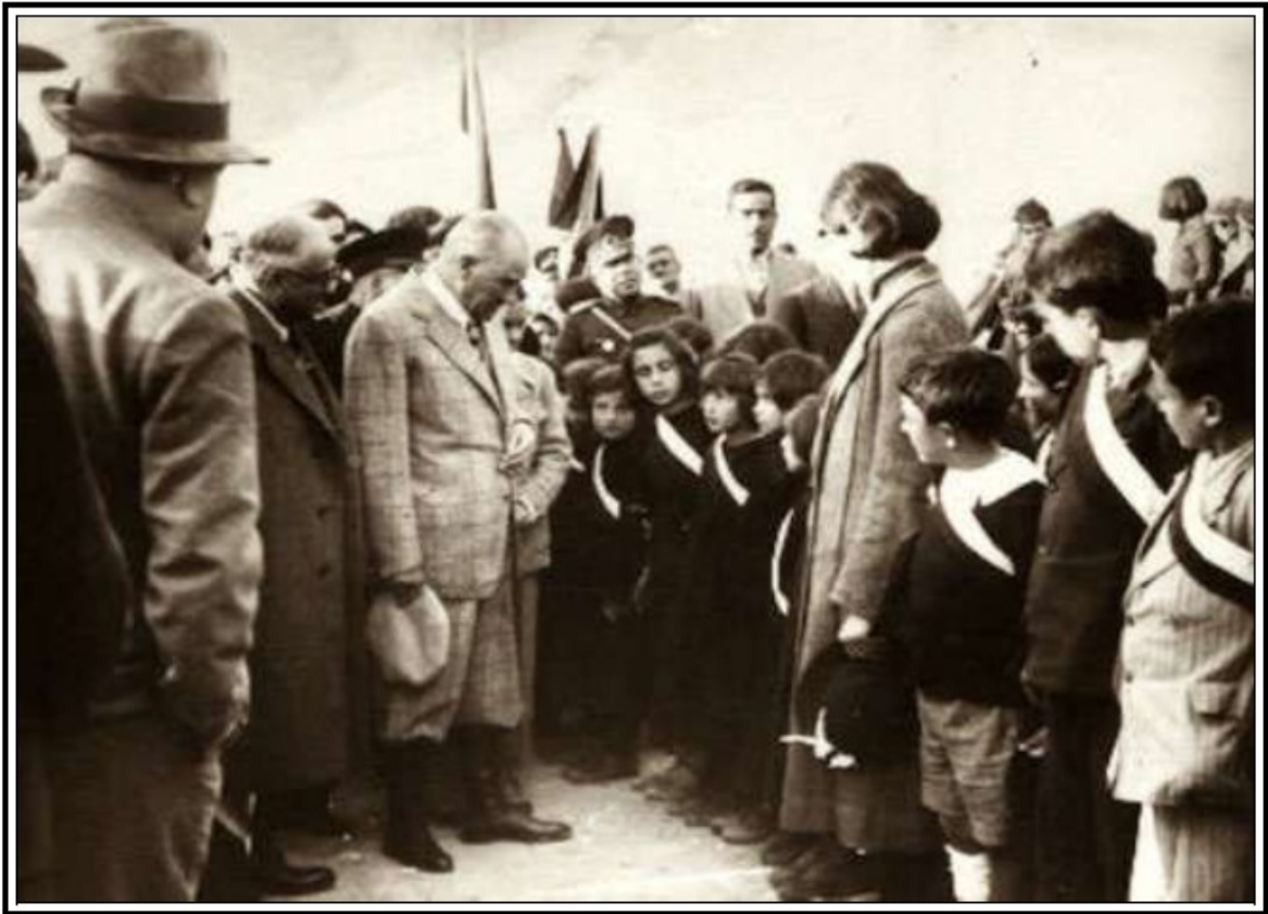
Cumhurbaşkanı Mustafa Kemal Atatürk, Pertek'te Öğrencilerle Konuşurken (17 Kasım 1937)