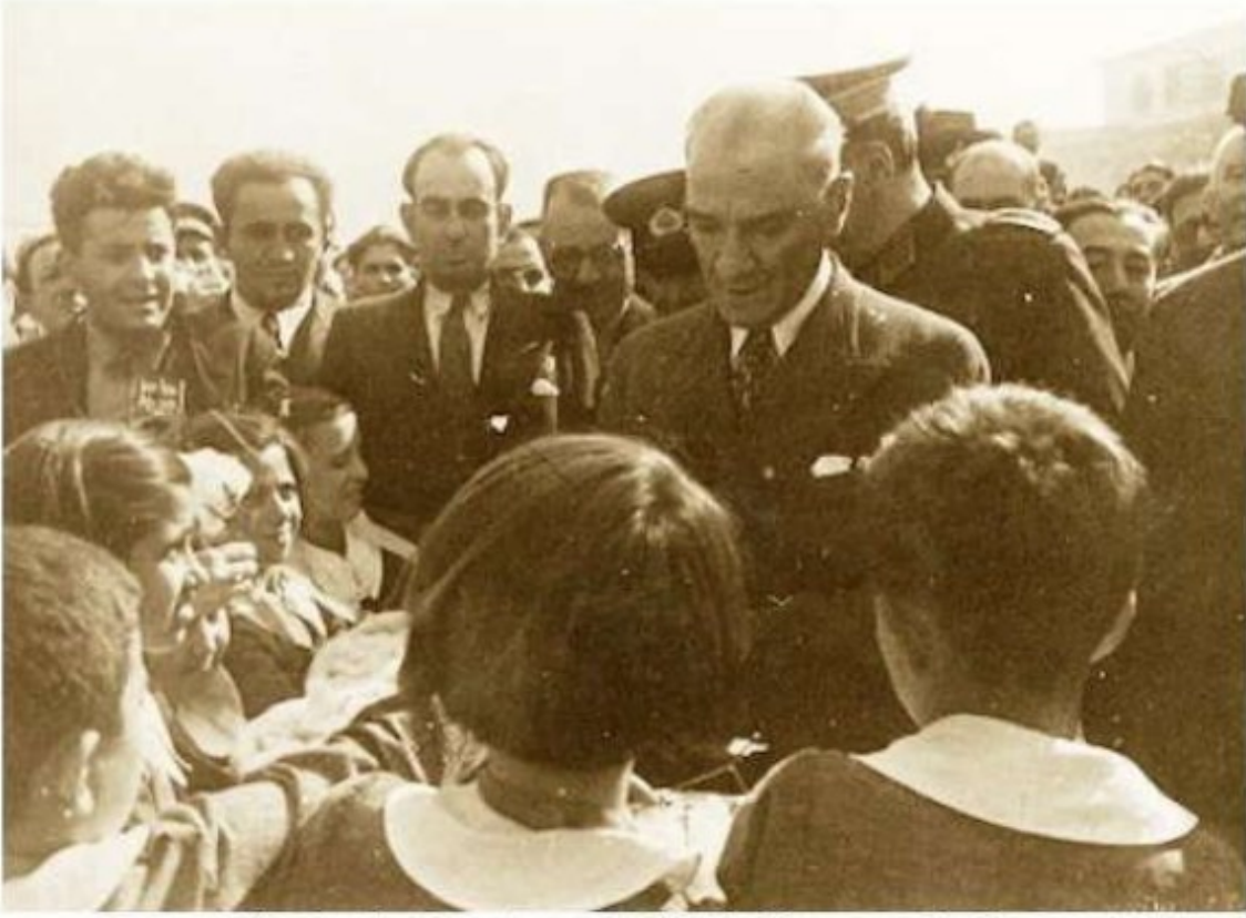
Cumhurbaşkanı Atatürk, Nazilli'de öğrencilerle (9 Ekim 1937)