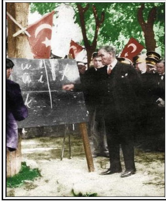
Cumhurbaşkanı Gazi Mustafa Kemal, yeni Türk harflerini halka bizzat öğretirken (20.09.1928)